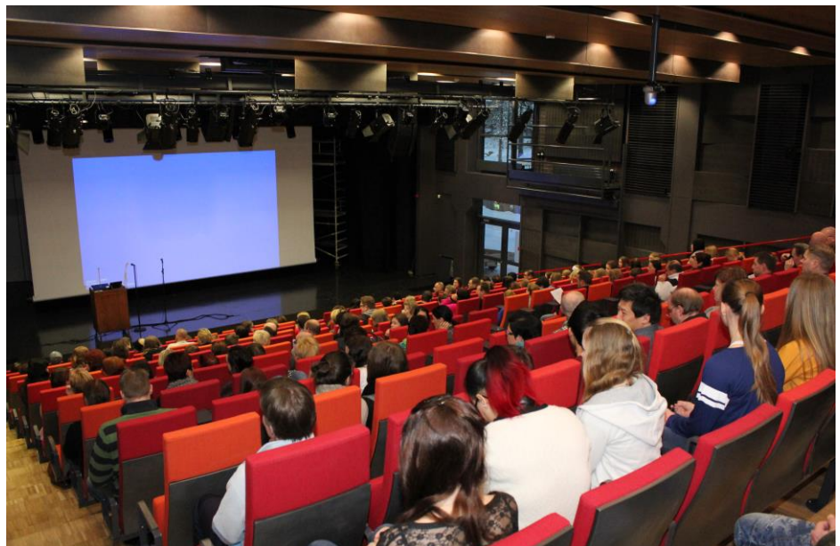
Avointen ovien aluksi auditoriossa.

Kahdeksas- ja yhdeksäsluokkalaisten ohjelmassa oli aamupäivällä valinnaisaineita. Seitsemäsluokkalaisten huoltajineen kiersivät luokissa tutustumassa valinnaisaineisiin, sillä heidän piti tehdä omat valintansa lähipäivinä. Myöhemmin päivällä seiskoilla ja kaseilla oli luokanvalvojantunnit ja eri aineiden oppitunteja, joille niillekin myös vieraat olivat tervetulleita. Yhdeksäsluokkalaisten puolestaan saivat kuulla oppilaanohjaukseen liittyen useiden aikuisten tarinoita työ- ja opintopoluistaan.