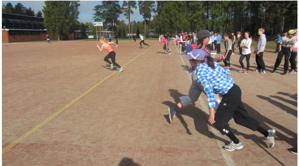
Liikuntapäivän sukulaviesti.