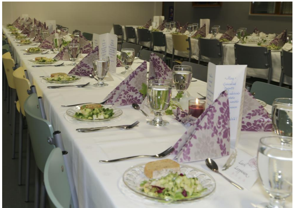
Juhlalounaan kaunista kattausta.