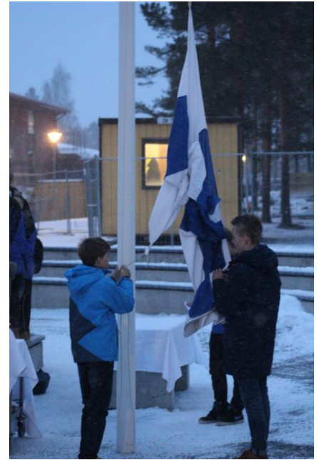
Itsenäisyyspäivän aaton lipunnosto.