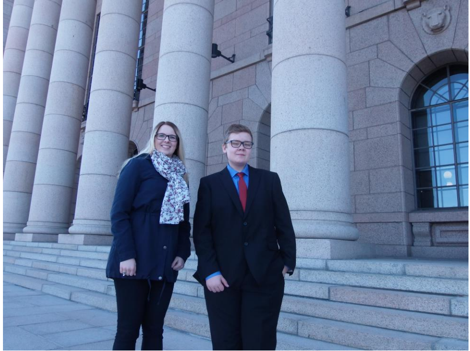
Nuorten parlamentti. (Kuva: Anniina Karvinen.)

TET-info kahdeksasluokkalaisille Kankaanpääsalissa.