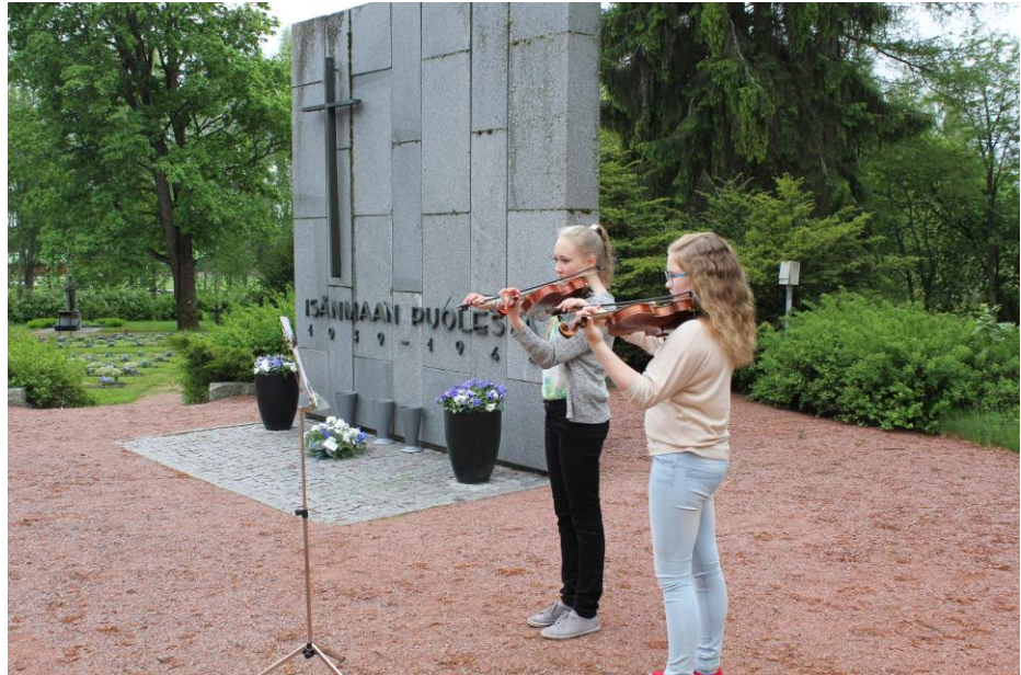
Kukat on laskettu. On musiikin vuoro.

30.5. Ysigaala. Oppilaskunnan seppeleenlasku sankarihaudoilla.