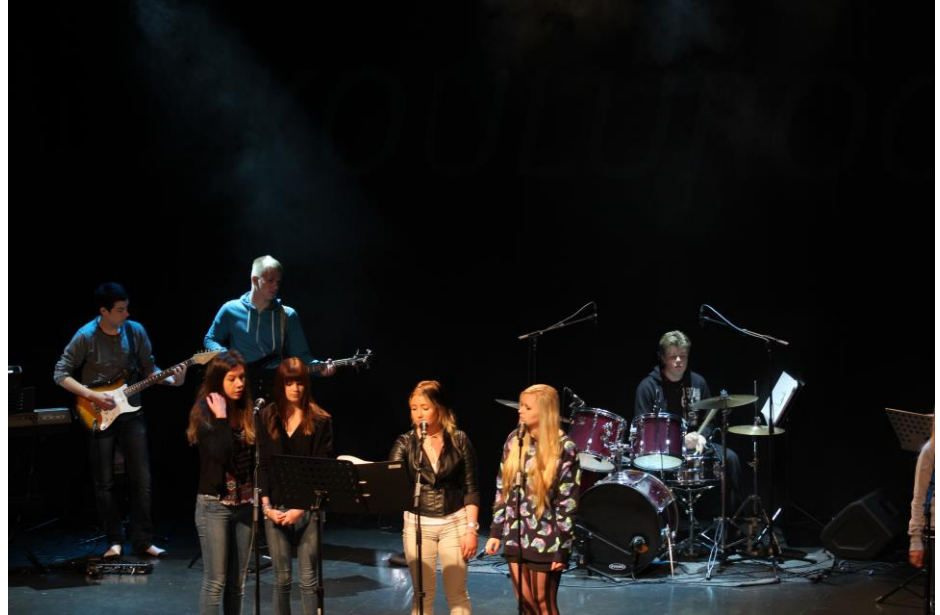
Koulurock, ysien valinnaisen musiikin ryhmä.