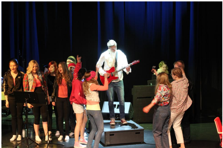
9B:n Vuosien varrella.