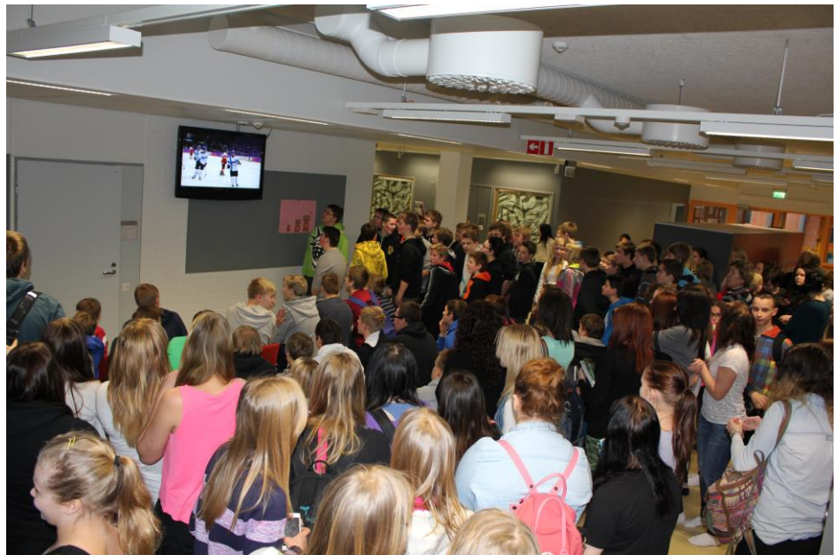
Pohjanlinnan olympiakatsomo.

Koko talvilomaa edeltävän viikon porukkaa kerääntyi ruokatunneilla ja tuntien alussa olympialaisia katsomaan seiskasoluun. Torstaisen Suomi–Itävalta-jääkiekkopelin aikaan katsomossa oli enimmillään kolmattasataa henkeä. Hyvin mahtui.